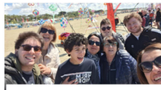
I ragazzi della goccia e della bottega

Viaggio di andata splendido e velocissimo con appuntamenti rispettati tra chi viaggiava con la propria auto e chi in pullman; viaggio di ritorno un po' lungo ( 4 ore ..causa un incidente all'uscita di Ravenna..) ma i gitanti non si sono per nulla sconfortati: anzi è stata un'occasione in più per chiacchierare, cantare, ridere e cementare le nuove amicizie giornalieri.